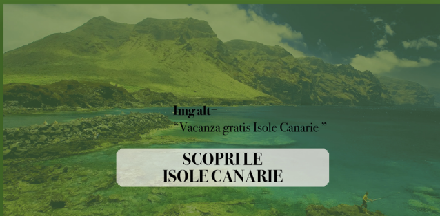
Img alt= "Vacanza gratis Isole Canarie"