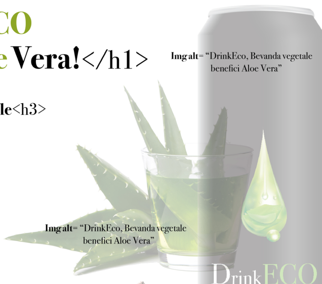
Img alt= "DrinkEco, Bevanda vegetale benefici Aloe Vera"

DrinkECO nasce dall'idea di voler intraprendere un progetto innovativo finalizzato a ottenere prodotti salutari e benefici sia per l'uomo che per l'ambiente. Da qui il naturale passaggio per un nuovo cammino insieme: la produzione di bibite ecologiche! Assapora la nostra nuova bevanda vegetale DrinkECO, scopri le proprietà Aloe Vera e partecipa al concorso fotografico "Selfie Eco Friendly", potrai vincere una vacanza gratis alle Isole Canarie, divertiti alla scoperta dell'isola e della nostra produzione ecosostenibile.